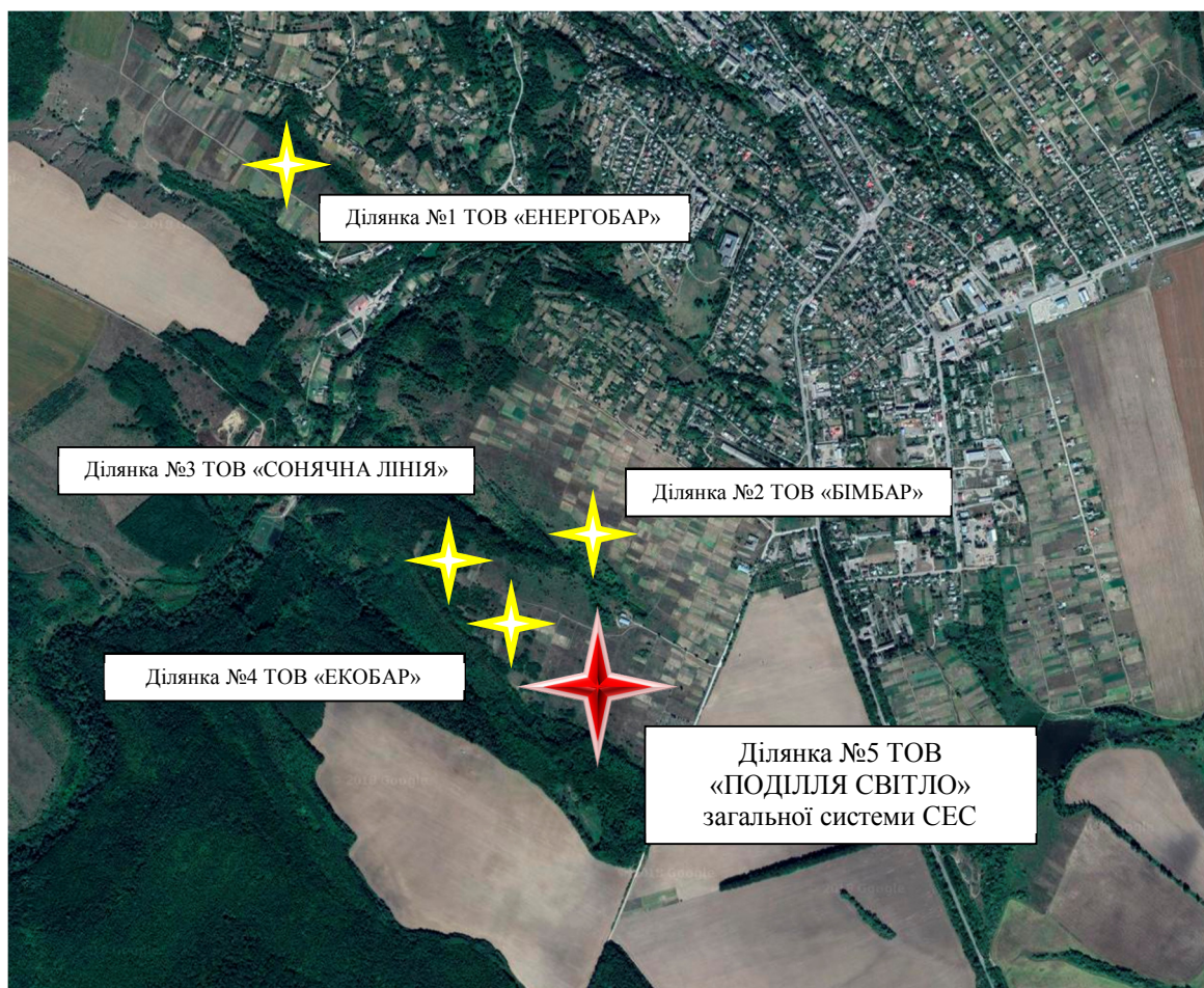
Рис. 3 – Місце розташування об'єкту планової діяльності