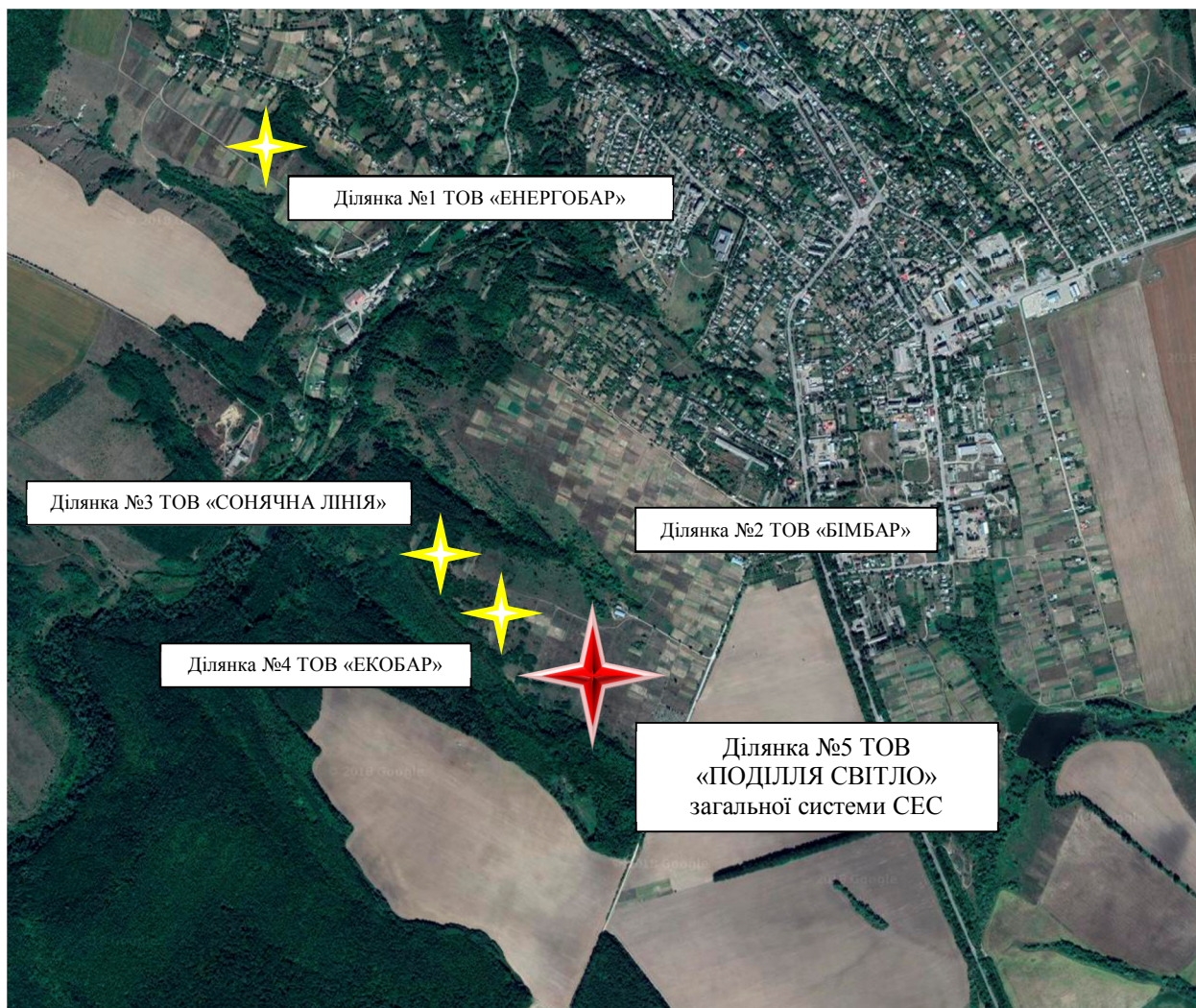
Рис. 1 – Місце розташування об'єкту планової діяльності

Згідно довідки, наданої Управлінням культури і мистецтв Вінницької обласної державної адміністрації, об'єкти культурної спадщини на даній земельній ділянці відсутні.